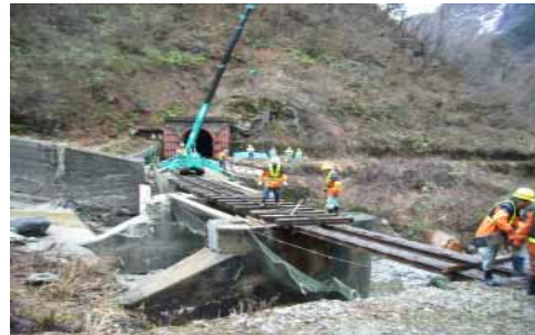
レール・枕木の撤去状況

雪害のおそれがある区間の電車線、レール、枕木、信号機および駅舎の屋根などを一時撤去致します。