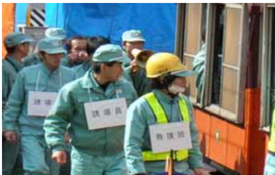
負傷者・乗客の誘導訓練状況