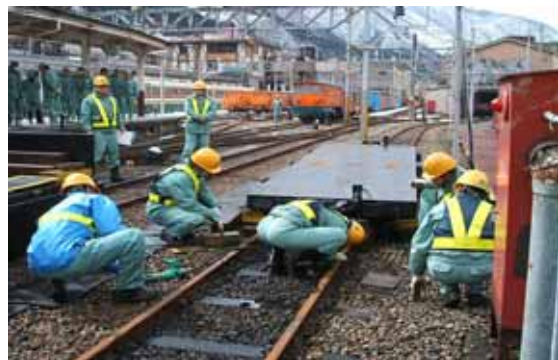
脱線した車両の復旧訓練状況