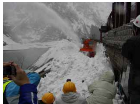
除雪車による除雪状況