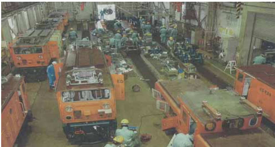
直営での車両整備状況

車両区員のほかに乗務員、駅務員が加わり、直営 ( 総勢約 8 0 人 ) で機関車や客車の整備を入念に実施するとともに構造や機能の理解に努め、技術力の維持向上に役立てております。