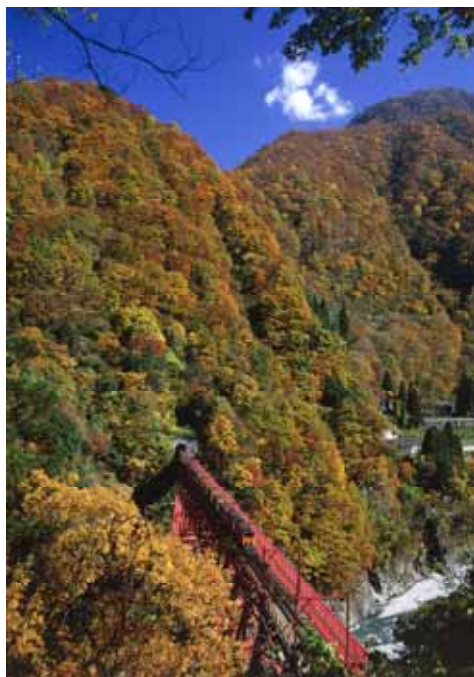
紅葉の黒部峡谷を走るトロッコ電車

当社は全従業員が輸送の安全確保を最優先にして、鉄道施設・車両のみならず、厳しい自然環境下での事業でありますので、山腹や護岸にも常に安全意識をもって取り組んでおります。また直接お客様の命を預かる乗務員には、心身の健全を維持し技能レベルの向上を図るよう取り組んでおります。ここに、本報告書を公表することにより皆様からの声を輸送の安全確保に役立てたく、積極的なご意見を頂戴できれば幸いです。